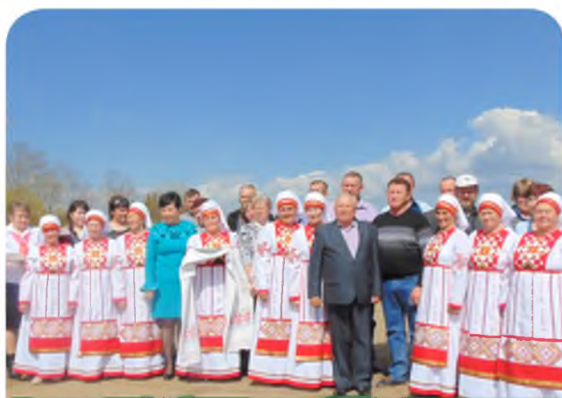
Встреча профактива в д. Удмуртские Ключи