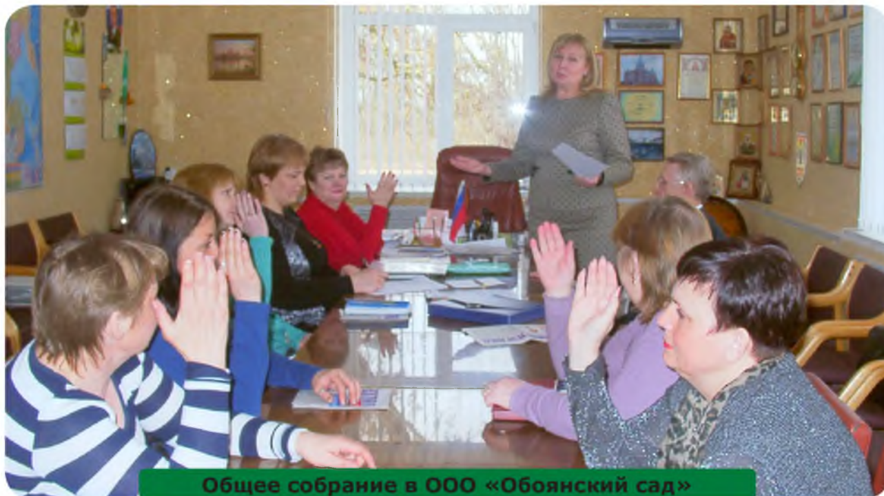
Общее собрание в ООО «Обоянский сад»

Объединение и создание своей первичной профсоюзной организации позволяет выступать с инициативой заключения коллективного договора, который по закону обязателен к исполнению всеми сторонами.