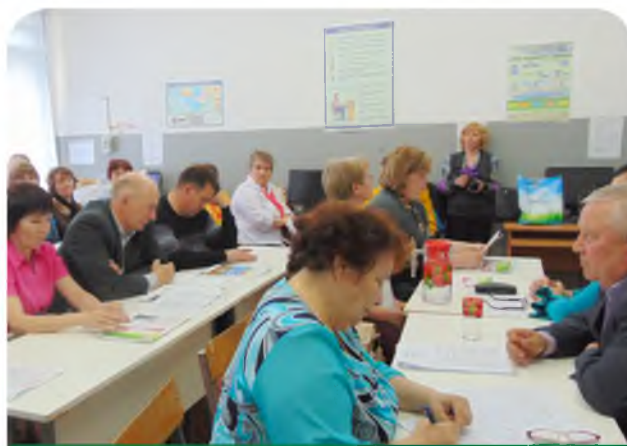
Заседание обкома в Глазовском районе